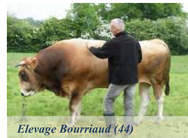
Elevage Bourriaud (44)

1987 Le premier taureau Nantais est collecté et sa semence stockée, grâce au financement de l'ITEB.