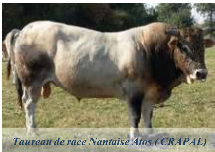
Taureau de race Nantaise Atos (CRAPAL)

LA REPRODUCTION : Un atelier d'élevage de taureaux, situé en Loire-Atlantique, élève actuellement 2 à 5 mâles chaque année, jusqu'à leur revente, à partir de 20 mois. Ils sont repérés lors de visites d'élevages avec en amont une sélection des mères grâce à l'aide de l'Idèle. Cet atelier permet d'améliorer la docilité des mâles, un travail très apprécié par les éleveurs qui achètent ces taureaux. Outre la sélection de futurs taureaux en élevage, une commission est dédiée à la diffusion et au placement de certains taureaux adultes encore aptes à la reproduction. Un travail avec l'IDELE a débuté pour repérer les vaches ou veaux les plus originaux génétiquement par rapport à la population avec une grille de description des vaches adultes, qui permettra d'affiner le repérage de mères à taureaux en amont. Concernant la collecte de semences, 19 taureaux sont actuellement disponibles à l'IA. La reproduction artificielle est soutenue par un programme de remboursement forfaitaire de l'association. L'IA facilite la gestion des petits troupeaux.