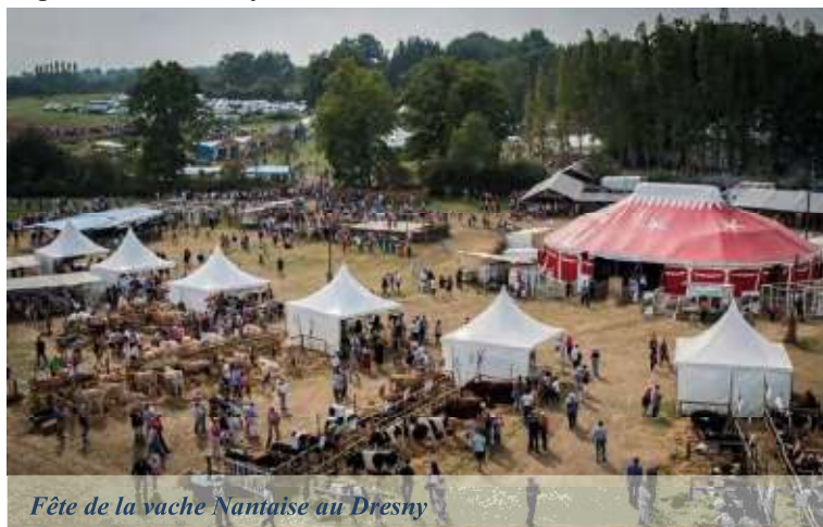
Fête de la vache Nantaise au Dresny

Organisation deux journées de formation à l'étude sensorielle.