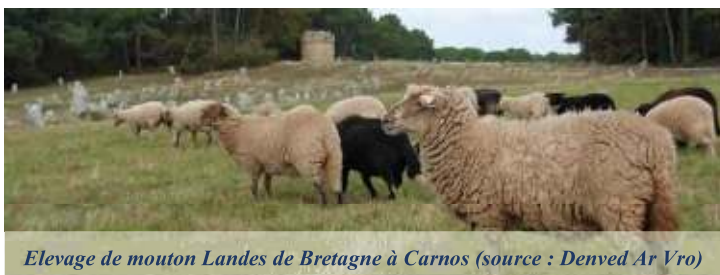
Elevage de mouton Landes de Bretagne à Carnos

Le mouton Landes de Bretagne doit d'abord son salut à une utilisation comme "tondeuse écologique" dans des réserves du littoral breton : il est introduit en 1988 au Cap Sizun (Finistère) dans une réserve de la SEPNE, en 1992 dans la Réserve naturelle de Séné (Morbihan), puis en 1995 sur le site mégalithique de Carnac (Morbihan).