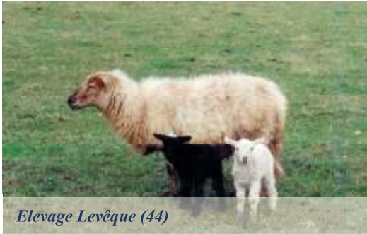
Elevage Levêque (44)