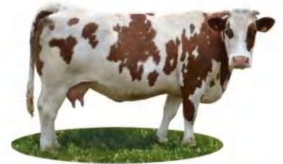
Syndicat de la race Saosnoise

Parvient à se dégager du temps libre grâce à l'aide de ses enfants (agriculteurs eux-aussi) et de ses voisins Prend quelques jours de vacances en été, laissant la surveillance de son troupeau à un de ses voisins