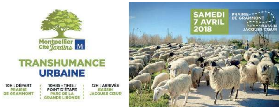
Photographie 5 : Les nouvelles transhumances urbaines à Montpellier