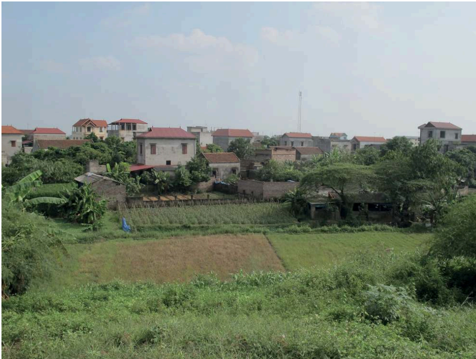
Photographie 4 : Bâtiments d'élevage à la lisière entre espace urbain et zone de culture en périphérie d'Hanoï

produisant des légumes, des fruits, du poisson et des fleurs grâce à la gestion des effluents d'élevage urbain (Kato, 2012 ; Cesaro, 2019). Mais l'avenir de cette ceinture est remis en cause par l'étalement de la ville et son développement économique (Sautier et al., 2014)