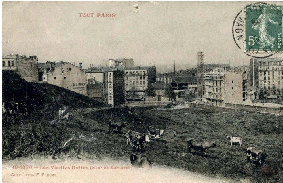
Photographie 1 : Carte postale de pâturages à Paris vers 1900

être aussi considérés comme des lieux d'élevage, au sens où des animaux sont maintenus à un même endroit, quelques heures, voire quelques jours, selon un flux continu d'approvisionnement et de mise en marché (Philipp, 2010). C'est pour cela que production laitière et production de viande sont historiquement liées à l'urbanité (Margetic, 2005).