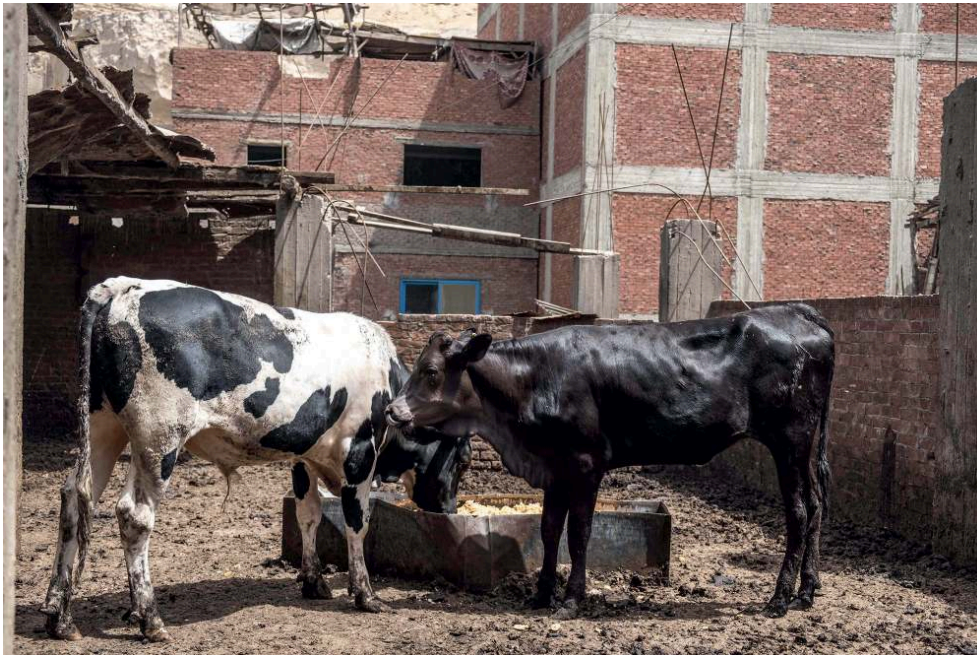
Photographie 2 : Vaches laitières sur les toits du Caire