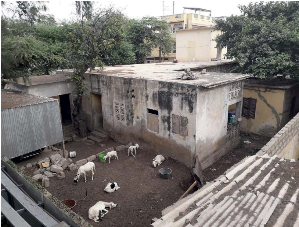
Photographie 3 : Un atelier d'embouche pour moutons dans un quartier de Saint-Louis (Sénégal)