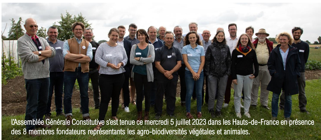
L'Assemblée Générale Constitutive s'est tenue ce mercredi 5 juillet 2023 dans les Hauts-de-France en présence des 8 membres fondateurs représentant les agro-biodiversités végétales et animales.

Une fédération nationale est née avec un objectif : agir pour sauvegarder et valoriser nos biodiversités domestiques et cultivées de toutes nos régions de France !