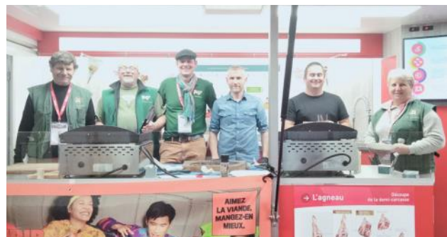
Les éleveurs de Saosnoises, mobilisés pour faire découvrir leurs viandes